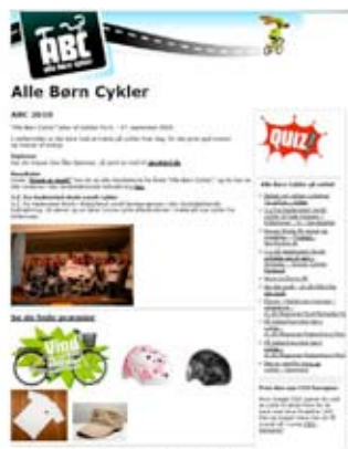
小学校における利用促進（自転車通学キャンペーン）

教育は徹底している。上の図左側は「小学校におけるルール啓発パンフレット」。ライトや反射板の装着を進めるキャンペーン。右側は「小学校における利用促進キャンペーン」。自転車通学を勧めている。日本の場合、通学路の安全が確保できず、小学生の自転車通学を禁止する例がほとんどだが、デンマークではルールはもちろん、安全のための装備や運転の仕方まで、わかりやすくクイズなどの手法を使って教育している。クイズも、楽しみながら理解するための設問になっている。小学生にもかんたんに理解でき、一般の常識で守ることができる交通ルールだからこそ可能な教育であることに注目したい。日本の例外だらけの複雑なルールでは難しい。