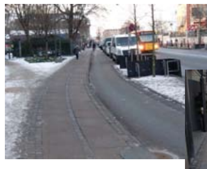
歩道・車道と独立した自転車道