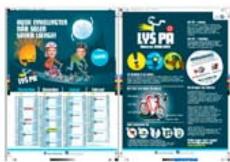
小学校におけるルール啓発（ライト・リフレクター装着キャンペーン）